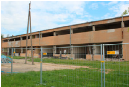
Umbau des PLANTAG-Werkes in Polen.

Mit den geplanten Investitionen sollen vor allem die Produktionsbedingungen für moderne Lacksysteme optimiert werden. Nach umfangreichen Investitionen in Lager und Logistik in den letzten Jahren erfordert die Entwicklung neuer moderner Produkte in den Bereichen „Wasserlacksysteme“ und „Strahlenhärtende Systeme“ eine Anpassung der Produktionstechnik, der Abläufe und Kapazitäten. Die Investitionen sind Ausdruck einer nachhaltigen Wachstumsstrategie, zu der auch die Fokussierung auf die Entwicklung umweltfreundlicher und moderner Lacksysteme beiträgt.